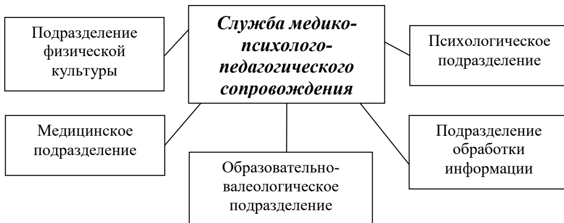
Рисунок. Организационная структура службы медико-психолого-педагогического сопровождения образовательной деятельности в МОУ Октябрьском сельском лицее

Соответственно подразделение физического воспитания объединяет преподавателей физической культуры, а также тренеров-педагогов дополнительного образования, ведущих в учебных заведениях спортивные секции. Психологическое подразделение – психолога и социального педагога.